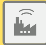
ГУДКИ ПРЕДПРИЯТИЙ И ТРАНСПОРТНЫХ СРЕДСТВ