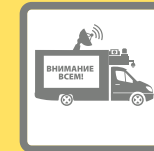
ПОДВИЖНЫЕ ЗВУКОУСИЛИТЕЛЬНЫЕ УСТАНОВКИ